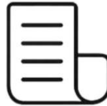
Papel y cartón limpio