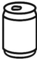
Latas de aluminio