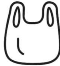
Bolsas de plástico