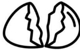
Cáscaras de huevo