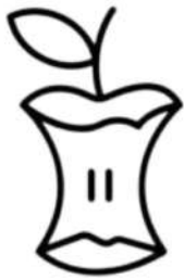
Restos de frutas y verduras