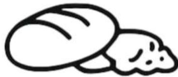
Pan, tortillas, arroz, frijoles