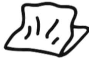
Servilletas de papel usadas