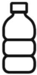
Botellas de plástico