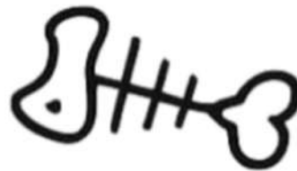
Restos de pescado